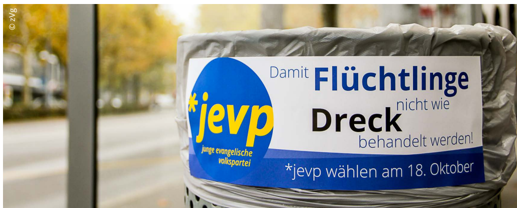
Strassenaktion der *jevp «Flüchtlinge nicht wie Dreck behandeln!»

Die Hoffnung steckt im Kleinen. Darum soll die persönliche Hilfe von freiwilligen Helfern, welche oft auch im Rahmen von kirchlichen Institutionen geleistet wird, unterstützt und nicht zusätzlich erschwert werden. Die Jungpartei fordert deshalb unter anderem eine Entbürokratisierung der privaten Aufnahme von Asyl-