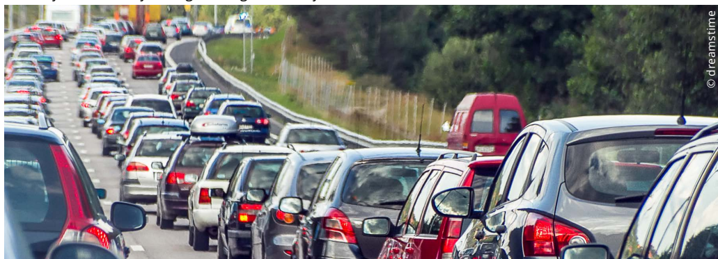
Stau auf der Nordumfahrung: Der tägliche Stau findet im Mittelland statt

als der tägliche Stau im Mittelland. Zudem ist die Sanierung ohne zweite Röhre eine Milliarde billiger und beansprucht erheblich weniger Land im engen Kanton Uri. Die EVP empfiehlt ein NEIN mit 108 zu 25 Stimmen.