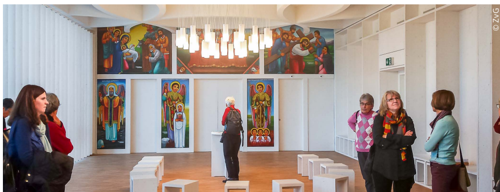
Christliche Kirchen verfügen über sehr unterschiedliche Ausdrucksformen

Beim Besuch der EVP-Frauen hielt eine junge Islam-Wissenschaftlerin - ursprünglich aus Bosnien, aufgewachsen in Glarus - einen sehr interessanten Vortrag. Sie studiert in Fribourg und arbeitet mit am Ziel, ein Schweizer Zentrum für Islam und Gesellschaft aufzubauen. In ihrer Familie erlebt sie einen pragmatischen Umgang mit der Religion, wie das in Bosnien üblich ist. Sie trägt ein Kopftuch, ihre Schwester hingegen nicht. Sie erklärte uns das Leben der Muslime im Alltag und in der Öffentlichkeit. Dass z.B. Töch-