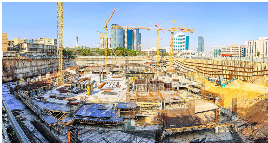
Unterbezahlte Arbeitskräfte auf Grossbaustellen – leider keine Seltenheit

Besonders auf Grossbaustellen werden immer wieder Arbeiter aus dem Ausland zu Hungerlöhnen eingeschleust. Der Generalunternehmer schiebt die Verantwortung auf den Erstauftragsnehmer ab, dieser wiederum auf seinen Sub-Unternehmer und dieser womöglich noch auf einen Sub-Sub-Unternehmer oder auf Schein-Selbstständige aus dem Ausland. Die grossen Skandale sind dabei nur die Spitze des Eisbergs. Die an sich möglichen Sanktionen sind zu schwach und kommen häufig zu spät. Geschädigt sind neben den direkt Betroffenen