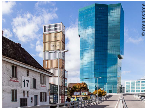
Keine Dumpingpreise für grosse Immobiliengeschäfte

bescheidene Besteuerung der «Grossen» aufzuheben. Bezahlen müssten die Zeche wie immer diejenigen, die im Bereich Bildung, Sozialwesen, öffentlicher Verkehr usw. auf staatliche Leistungen angewiesen sind. Die EVP lehnt die Vorlage einstimmig ab.