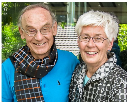
Ehepaare tragen auch Lasten

meinsames Einkommen wird höher besteuert als wenn die beiden Einkommen einzeln besteuert würden. Dies ist eine Folge der höheren Steuersätze auf höheren Einkommen (sog. Steuerprogression). Mit verschiedenen Abzügen wird versucht, diese unerwünschte Mehrbelastung zu korrigieren. Mit mässigem Erfolg. Die einzige praktikable Lösung wäre ein Steuer-splitting, bei welchem die beiden Einkommen zusammengezählt und dann zu dem für das halbe Einkommen geltenden Tarif zweifach besteuert werden. Die dadurch entstehenden Steuerausfälle haben bisher jedoch dazu geführt, dass diese einfache Lösung verworfen wurde. Steuervorteile zugunsten des Staates und zulasten von Familien – das darf kein Grund gegen die Abschaffung der Heiratsstrafe sein!